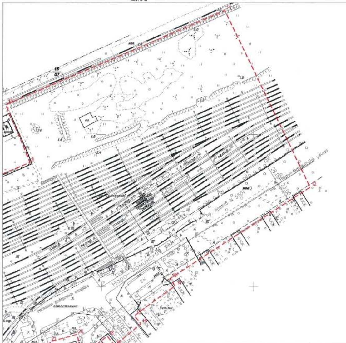
Ситуационный план Часть 2

разработан на топографической основе масштаба 1:2000