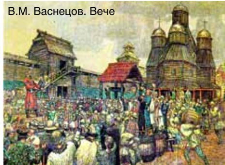
В.М. Васнецов. Вече

Современная избирательная система России – двадцать лет. Ее рождение было ознаменовано принятием Конституции Российской Федерации 1993 года – самой либеральной и демократической Конституции из всех, существующих в мире.