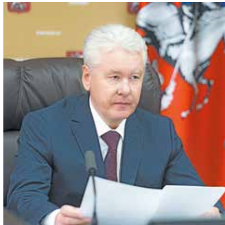
Мэр Москвы С. Собянин

Честность и прозрачность предстоящих выборов в Мосгордуму — одна из ключевых задач, которую поставил перед Избиркомом Мэр Москвы Сергей Собянин. Он еще раз напомнил об этом на заседании президиума Правительства Москвы.