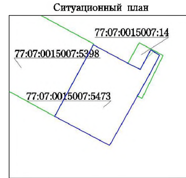
Координаты границ земельного участка